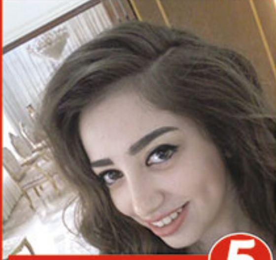
٥ ساندر حمة بلان 2871

مؤسسة هدهد تبارك للمتفوقون الأوائل في الشهادة الثانوية وترى فيهم مستقبل البلد