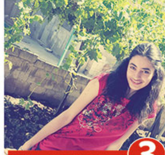
٣ فرات فضل الله الهزيم 2877